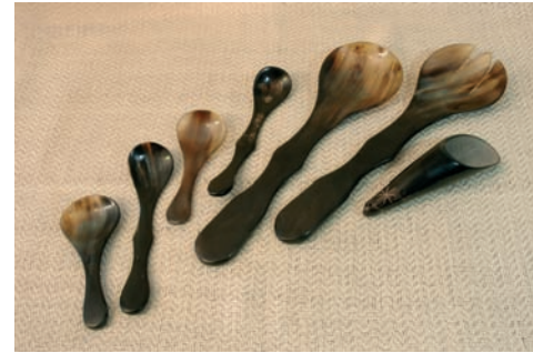
Cucharas de asta de vacuno (Argentina).