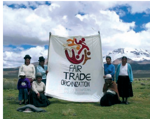
Lanzamiento Marca IFAT en Latinoamérica.