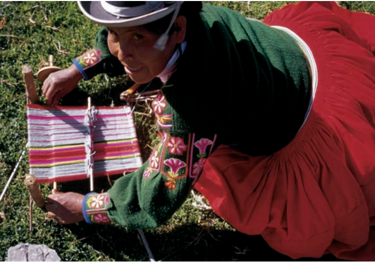
Tejedora en Lago Titicaca. CIAP (Perú).

para artesanos y artesanas de Latinoamérica