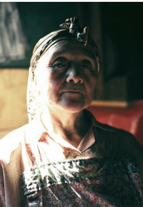
Artesana de la Fundación Chol Chol (Chile).

para artesanos y artesanas de Latinoamérica