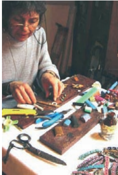
Artesana. Taller SES, organización de Comercio Justo (Uruguay).

para artesanos y artesanas de Latinoamérica