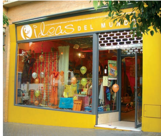
Tienda de Comercio Justo. IDEAS del Mundo (España).

Estas organizaciones aglutinan a los diferentes actores antes mencionados, velando por el cumplimiento de los principios de Comercio Justo,