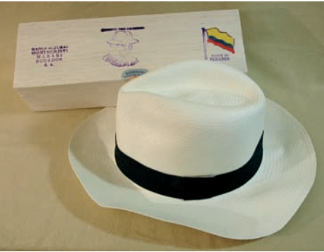
Sombrero originario de Ecuador.

para artesanos y artesanas de Latinoamérica