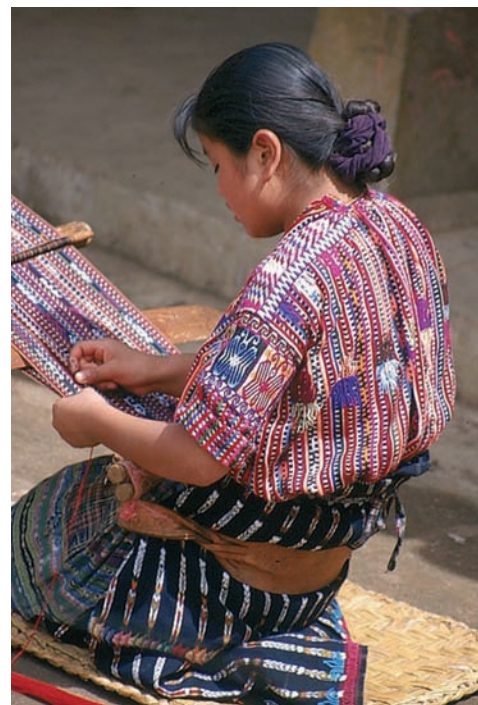
Tejedora grupo Chaquiyja en Lago Atitlan, Aj Quen (Guatemala).

La organización se encarga de aumentar el conocimiento sobre el Comercio Justo y la conciencia acerca de la necesidad de una mayor justicia en el comercio mundial a través de campañas y acciones de denuncia. Así, los