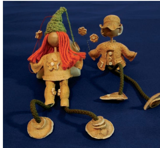
Muñequitos de piel de naranja (Colombia).

La comunidad internacional ha aceptado estos criterios de Comercio Justo y claro ejemplo de ello es el Parlamento Europeo que recientemente los recoge explícitamente en una de sus resoluciones. Estos criterios son: un precio y un salario justo; prefinanciación si es requerida;